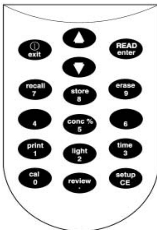
表 1 按键及功能